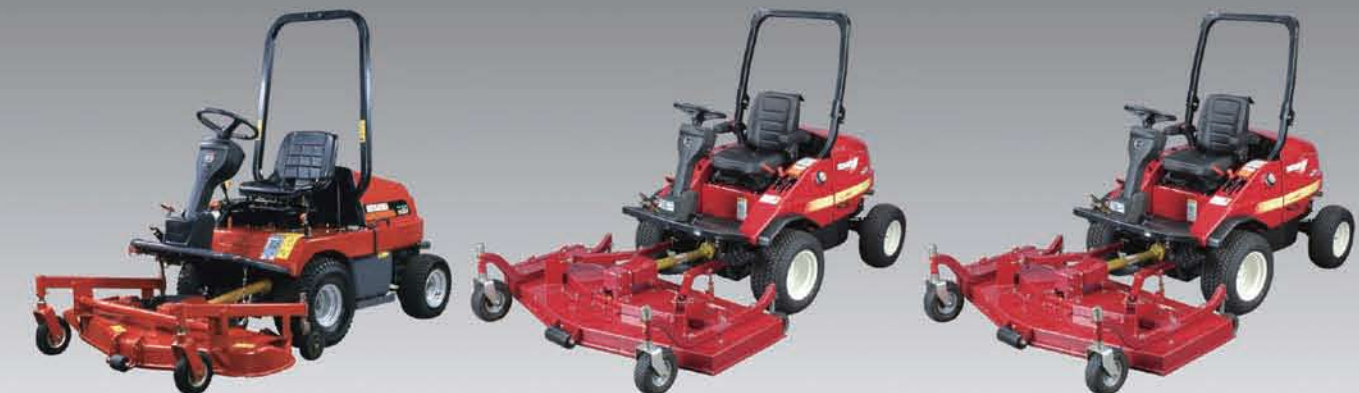
CM214 24 pk/ (17,6 kW)

De Shibaura motoren zijn ideaal wat betreft makkelijk onderhoud. Aan één kant van de motor kan het oliepeil gecontroleerd worden, het oliefilter vervangen worden en al het andere onderhoud worden gedaan.