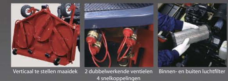
Verticaal te stellen maaidek 2 dubbelwerkende ventielen 4 snelkoppelingen Binnen- en buitenluchtfilter